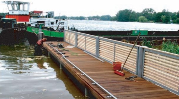
Badesteg am Werlsee